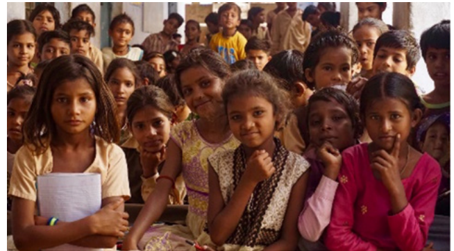
4) Gratis, voltijds regulier onderwijs in Budhpura