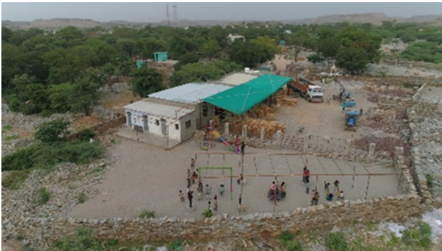
3) Speelplaats en kinderopvang voor kinderen van werknemers