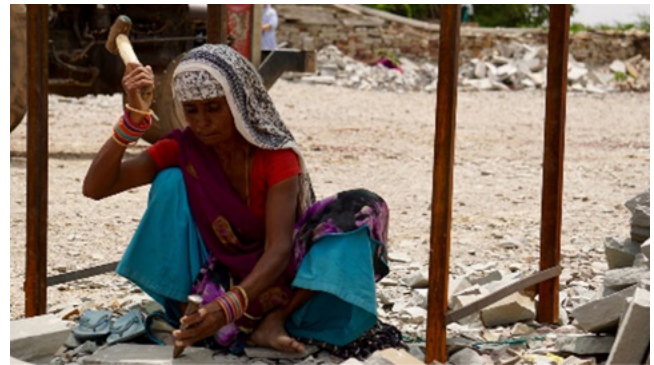
2) Schaduwplekken om te werken